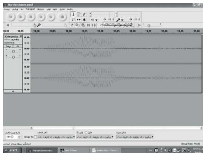
شکل موج آیه ابتدایی داستان دو مرد باغ‌دار / زوم به داخل / روان خوانی «وَاضْرِبْ لَهُمْ مَثَلًا رَجُلَيْنِ جَعَلْنَا لِأَحَدِهِمَا جَنَّتَيْنِ مِنْ أَعْنَابٍ وَحَفَفْنَاهُمَا بَسْحَلٍ وَجَعَلْنَا بَيْنَهُمَا زَرْعًا» (کهف / ۳۲)