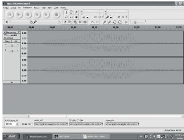
شکل موج آیه ابتدایی داستان خضر و موسی / زوم به داخل / روان خوانی

«وَإِذْ قَالَ مُوسَىٰ لِفَتَاهُ لَا أَبْرَحُ حَتَّىٰ أَبْلُغَ مَجْمَعَ الْبَحْرَيْنِ أَوْ أَمْضِيَ حُقُبًا» (کهف / ۶۰)